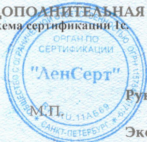
Схема сертификации 1с.